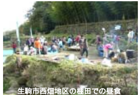
生駒市西畑地区の榎田での昼食